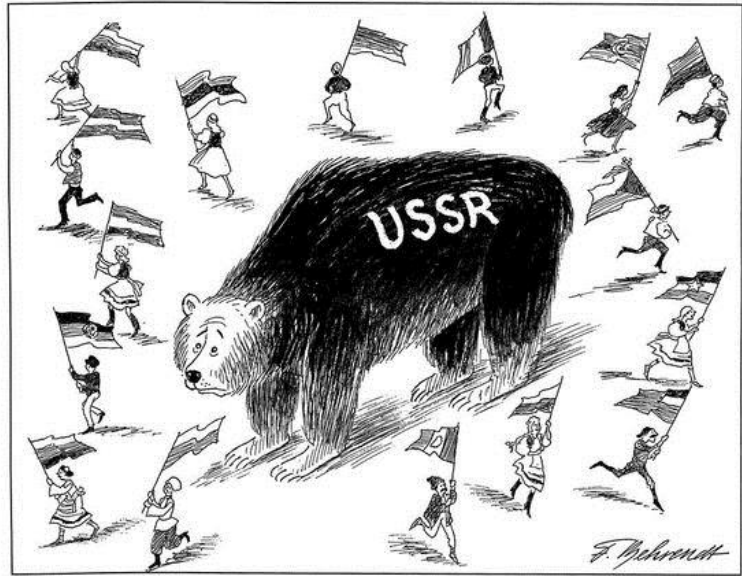
Der große Auszug (1990)